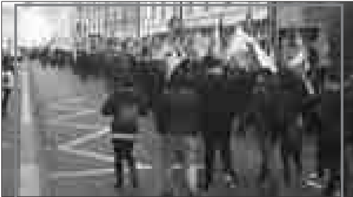
İsviçre'nin Basel kentinde Newroz, onbinlerce kişinin katılımıyla, coşkuyla kutlandı.

İstanbul'daki mitingde ise, kitleler tek girişten alındı. Başlangıçta miting alanına 18 yaş altı ve 65 yaş üstü olanlar alınmadı. Yapılan görüşmelerin ardından, onların da alana girişine izin verildi. İstanbul'da ayrıca bazı pankartlar, flamalar konusunda polis sorun çıkardı. Yeni Demokrat Gençlik'in flamalarına el kondu. BDSP kortejini alana almak istemeyen polisin tutumu karşısında direnen BDSP kortejine, çevredekiler de destek verince, polis geri adım attı. Yenikapı Meydanı'nda gerçekleştirilen mitingde, HDP bileşeni yapıların yanısıra HDP Eş Genel Başkanı Pervin Buldan, Sırrı Süreyya Önder, milletvekilleri ve parti başkanları, Boğaziçi Üniversitesi öğrencileri katıldı. Yapılan konuşmalarda Öcalan üzerindeki tecride, cezaevlerinde PKK'li tutsakların sürdürdükleri açlık grevlerine değinildi. Pervin Buldan konuşmasında "AKP ve küçük ortağına seçimlerde gereken dersi vereceğiz" diyerek yine kitleleri seçim sandığına çağırıyordu. Sloganların atıldığı ve halayların çekildiği mitingde 14 kişinin gözaltına alındığı açıklandı. Gözaltına alınanlardan bazılarının, ev hapsi cezası olan, ancak Newroz'a gelerek