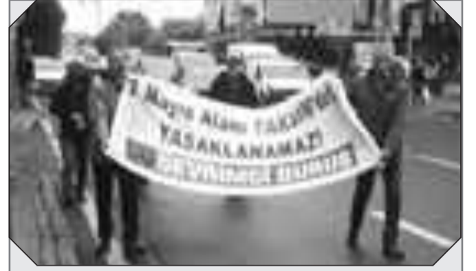
PDD okurları 1 Mayıs günü Okmeydanı SSK önünde 1 Mayıs eylemi gerçekleştirdi.

1 Mayıs'ı kutlamak isteyenler değil sadece, 1 Mayıs günü çalışmak veya bir yere gitmek zorunda olanlar da saatlerce yol yürüdü, kesilen sokaklardan dolayı polisle